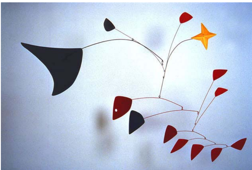
La estrella, móvil (1960)

Los primeros móviles y stables de Calder eran de pequeño tamaño. Más adelante realizó esculturas monumentales, para colocar en grandes espacios urbanos.