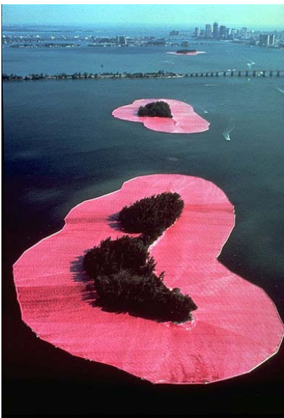
Islas Rodeadas: once islas de Florida enmarcadas con tejido plastificado de color rosa. Realizado en 1983.