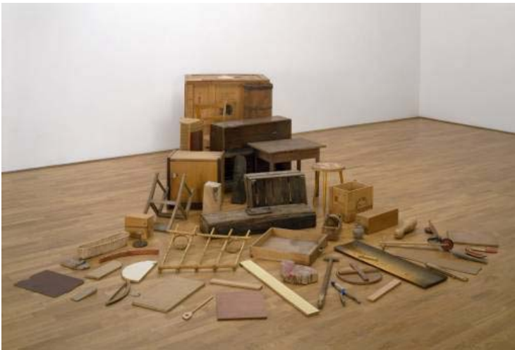
Cabeza de hacha (1982)