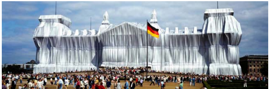
El Reichstag , edificio del parlamento alemán, envuelto en 1995.