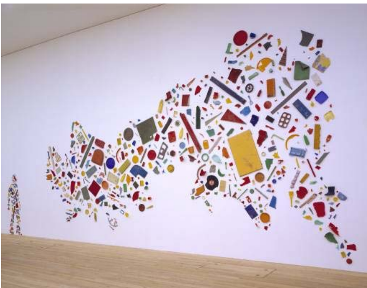
Gran Bretaña vista desde el norte: Mural de trozos de plástico y objetos de colores. Realizado en 1981.

Como puedes ver, algunas de sus esculturas son materiales diversos amontonados, partidos o aplastados.