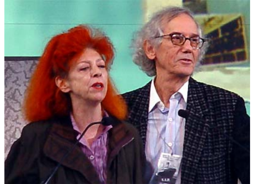
Jeanne Claude y Christo

A esta forma de arte se la llama instalación . Ellos han hecho muchas en diversos países. Fíjate en los ejemplos: