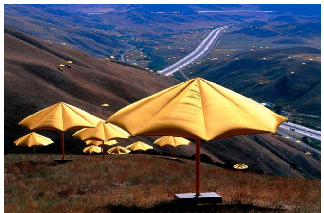
Los paraguas; proyecto que consistió en instalar simultáneamente 1.540 paraguas azules en Japón, y 1.760 amarillos en California (EEUU). El proyecto se finalizó en 1991.