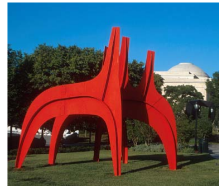
Caballo rojo (1974)

Cuando vivía en París, hizo retratos de sus amigos a base de alambre, donde lo importante son las líneas sencillas y el espacio hueco.