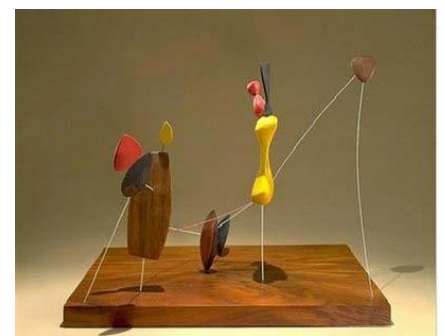
Constelación con hueso amarillo (1947)

Los primeros móviles y stables de Calder eran de pequeño tamaño. Más adelante realizó esculturas monumentales, para colocar en grandes espacios urbanos.