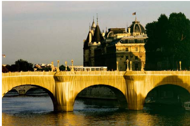
El Pont Neuf: un conocido puente de París, envuelto por ellos en 1985.